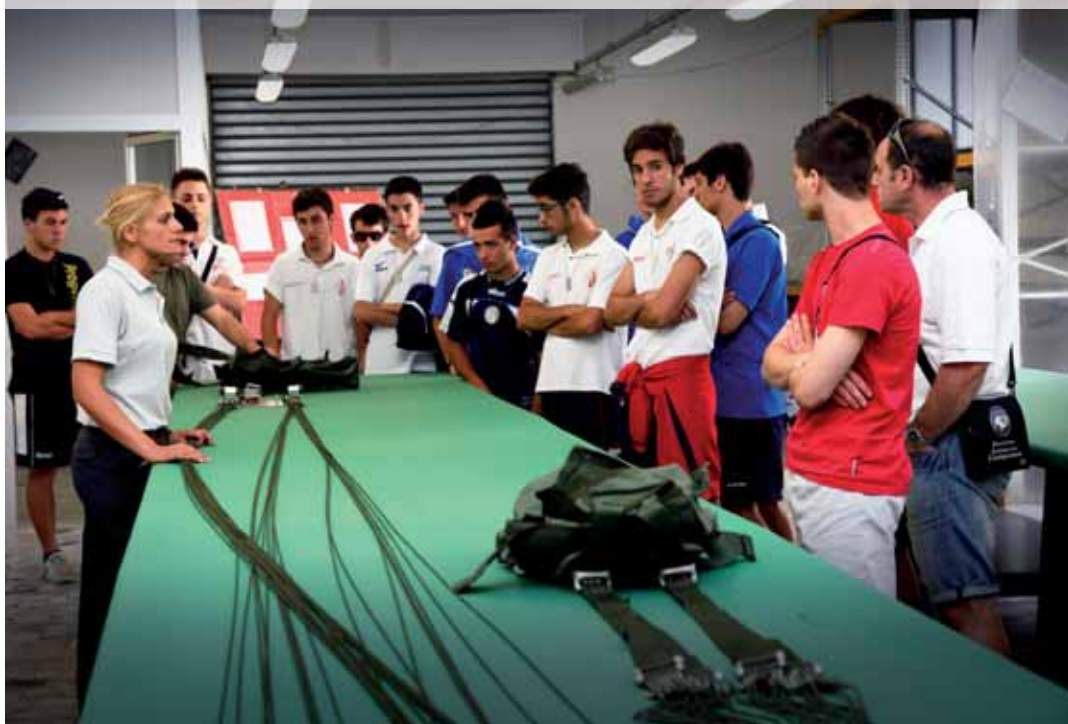
Visita alla sala ripiegamento paracadute

partecipato con entusiasmo alla Fossil Cup, il più importante torneo di calcio allievi della regione Emilia Romagna, e nel 2009 alcuni paracadutisti si sono addirittura calati nel campo da calcio in cui si stava disputando la finale, lasciando attoniti i presenti. Dopo anni di collaborazione, in cui tra collegamenti via web con i reggimenti di ruolo in Afghanistan (è successo durante la finale del 2011) e dimostrazioni pratiche la Brigata si è fatta conoscere dalla provincia reggiana, quest'anno una delegazione della