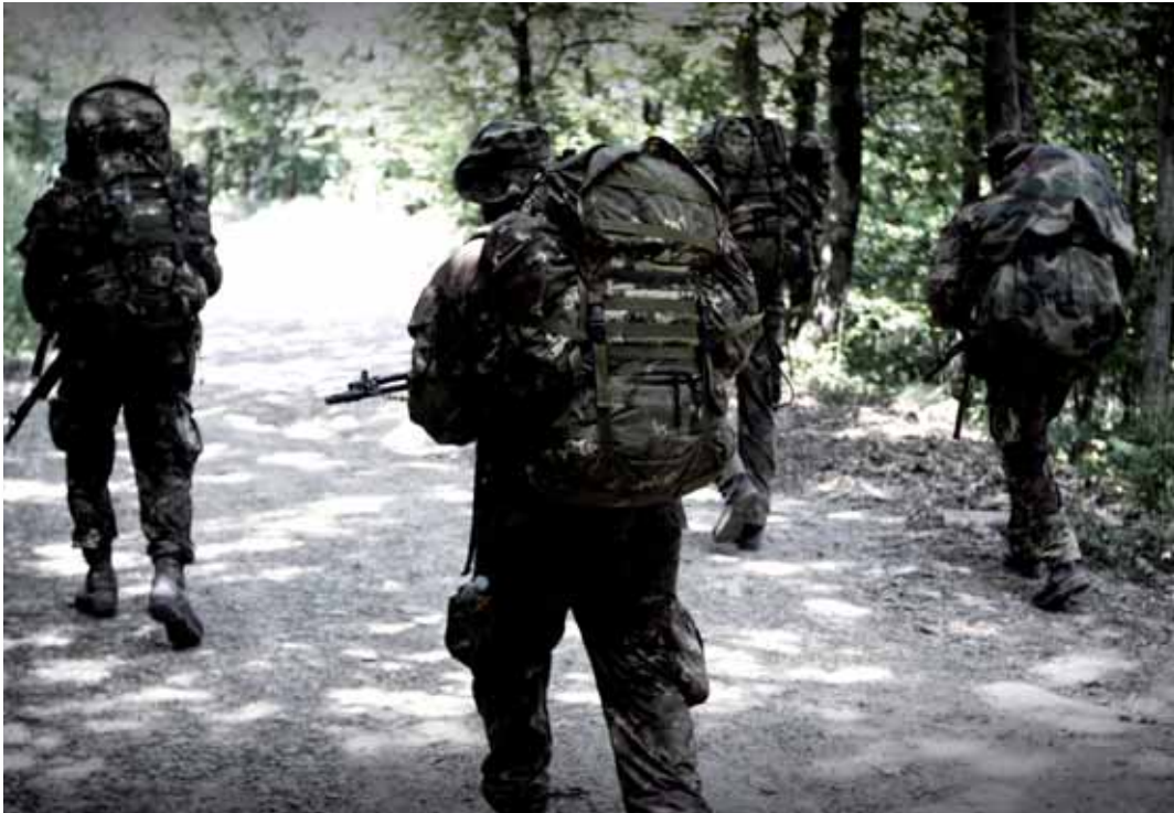
Una delle prove di marcia