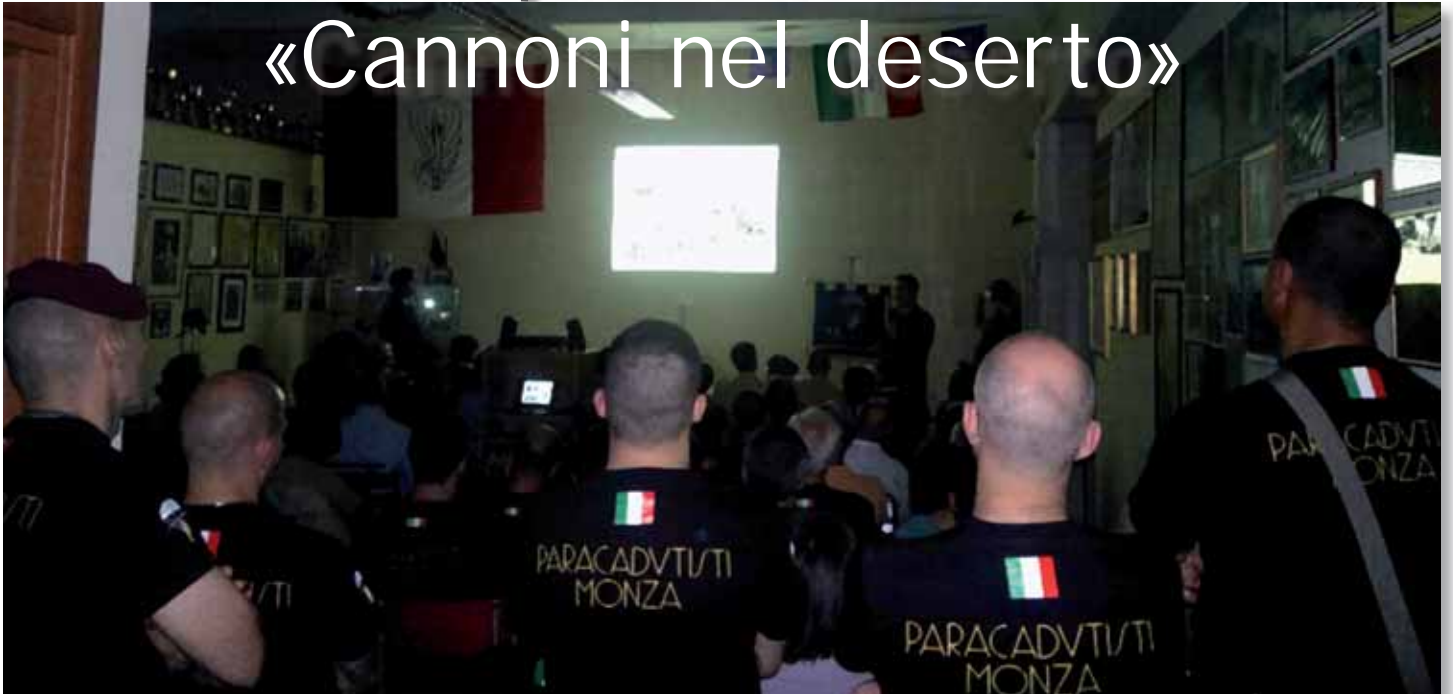
La sezione gremita di ospiti e paracadutisti che assistono alla proiezione

A ncora una volta la sezione di Monza dell'Associazione Nazionale Paracadutisti d'Italia ha fatto da degna cornice ad un importante evento tenutosi giovedì 14 giugno: la presentazione dell'ultimo libro di Renato Migliavacca "Cannoni nel deserto".