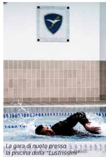
La gara di nuoto presso la piscina della «Lustrissimi»

Da diversi anni il «Trofeo Fanti dell'Aria» così chiamato in onore dei primi reparti paracadutisti italiani, costituiti nel 1938 a Castel Benito in Libia, rappresenta per i paracadutisti in ser-