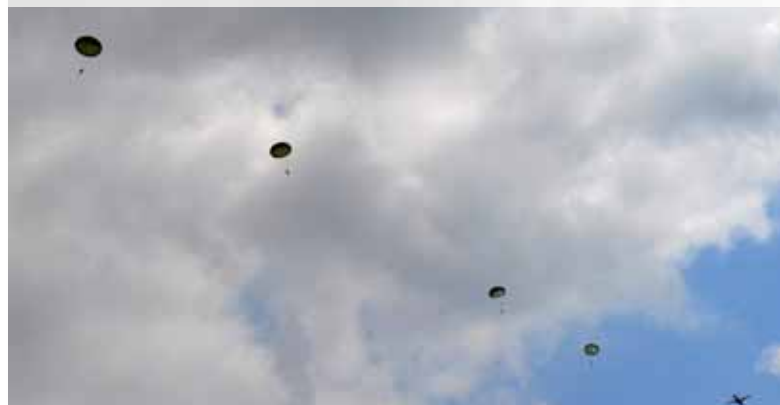
Dopo 8 anni ecco in volo il primo passaggio ANPd'I da velivolo militare

Il giorno 29 maggio sulla zona lancio di Tassignano (LU) il primo decollo di paracadutisti ANPd'I ha ripreso l'attività aviolancistica di allenamento, con materiale, velivoli e organizzazione militare. In forza della Convenzione firmata con lo SME e dell'innovativo contratto di permuta, stipulato nel marzo scorso (vedi "Folgore" n. 2 anno 2012 pagg. 5-6), con la Brigata paracadutisti, 12 paracadutisti ANPd'I, potranno effettuare, mensilmente, un lancio "militare". Alla presenza del Presidente