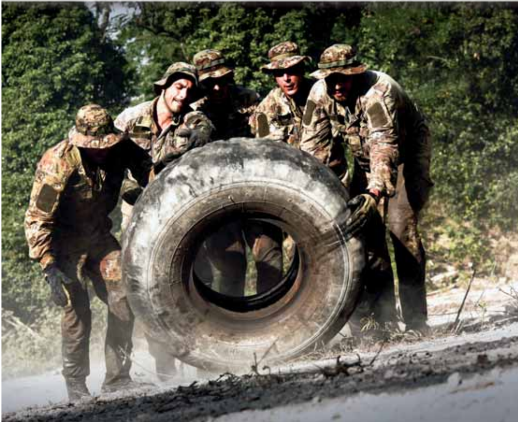
Una delle prove sul "percorso degli spartani"