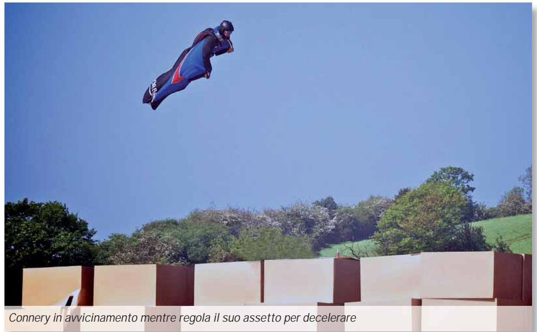
Connery in avvicinamento mentre regola il suo assetto per decelerare