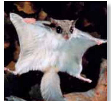
Lo scoiattolo volante a cui si sono ispirati i progettisti delle tute alari

Attualmente, i paracadutisti che utilizzano le tute alari, sono in grado di misurare le loro prestazioni con apparecchiature GPS in grado di determinare la durata del volo, l'altitudine a cui ci si è lanciati e quella in cui si è aperto il paracadute, la velocità orizzontale, il tasso di caduta, nonché tracciare e registrare il percorso di volo.