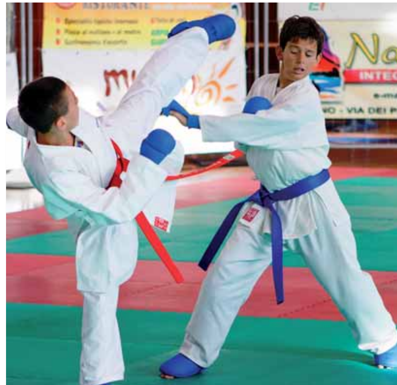
Una fase del "Kumite" (combattimento)