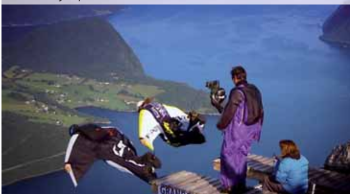
Due «base jumpers» mentre si lanciano muniti di tuta alare

Utilizzata inizialmente come tecnica propria degli «stuntman» in telefilm di azione degli anni '70 e '80 si è progressivamente diffuso. Il primo salto «base» su scatoloni, senza paracadute, è stato effettuato dall'illusionista David Blaine il 22 maggio 2002 da 27 metri su di una pila di scatole di cartone alta 3,7 metri. Il 19 novembre 2009, il tedesco Ferdinand Fischer è atterrato sugli scatoloni alla velocità di 30m/s (oltre 100km/h) avendo realizzato un salto da un dirupo di 45 metri.