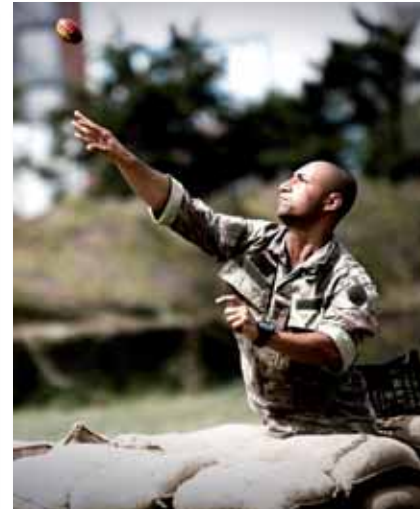
Lancio della bomba a mano

vizio quello che per gli alpini sono i loro campionati di Specialità: i Ca.S.T.A.