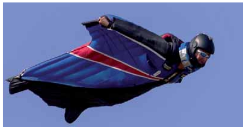
Connery ripreso durante il volo, si può distinguere il collare con la strumentazione di rilevamento dei parametri di volo