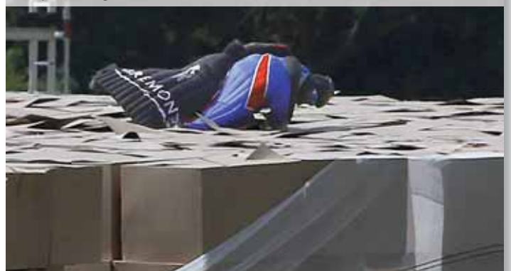
L'impatto sugli scatoloni a 112,5 km/h

to sensibilmente il livello di sicurezza.