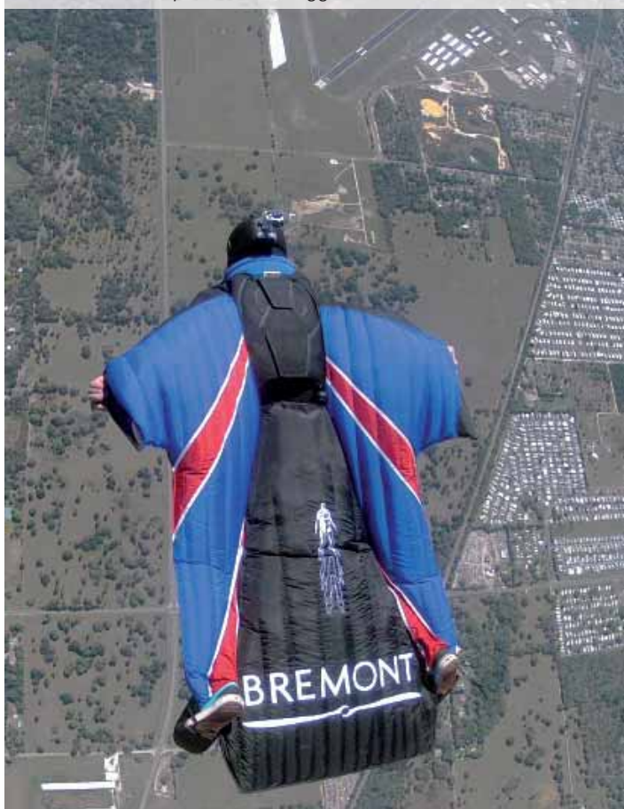
Gary Connery in volo durante il lancio record, in alto a destra la pista di atterraggio

Lo scorso 23 maggio 2012 lo «stuntman» (cascatore) e «base jumper» britannico Gary Connery, dopo un aviolancio da circa 750 metri di altezza, è entrato nella storia, diventando il primo uomo ad atterrare per mezzo di una tuta alare senza aprire un paracadute. L'atterraggio è avvenuto nei pressi di Henley-on-Thames (Inghilterra) su di una striscia