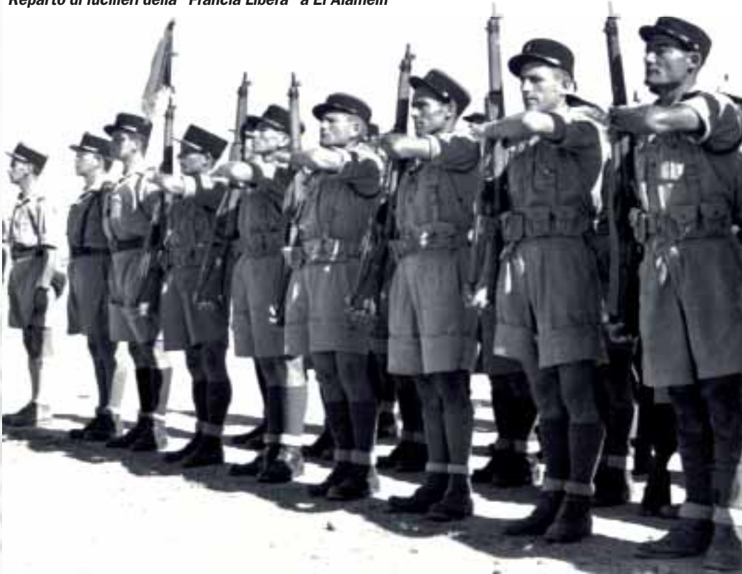
Reparto di fucilieri della "Francia Libera" a El Alamein