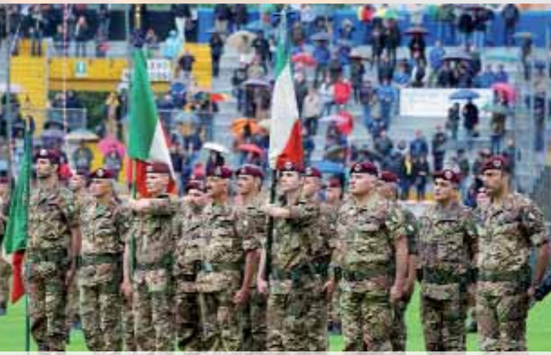
Le Bandiere di Guerra presenti alle celebrazioni