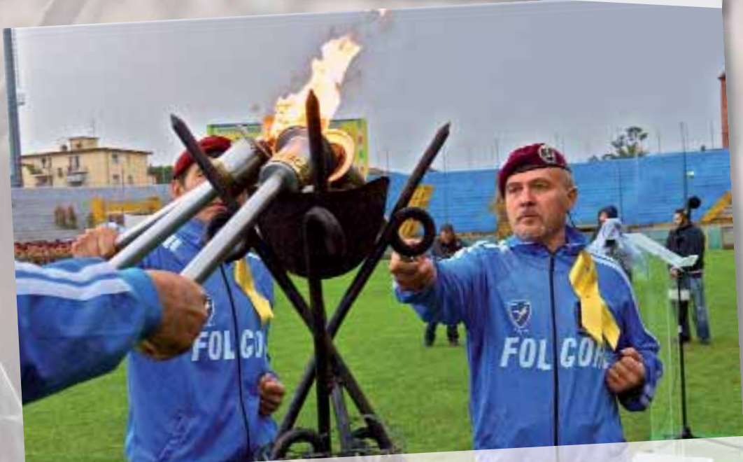
L'accensione del «braciere degli ideali»

«Oggi, seppur in maniera ridotta, celebriamo più di una ricorrenza: il trentesimo anniversario delle missioni di pace e il settantesimo della battaglia di El Alamein, e lo facciamo nel