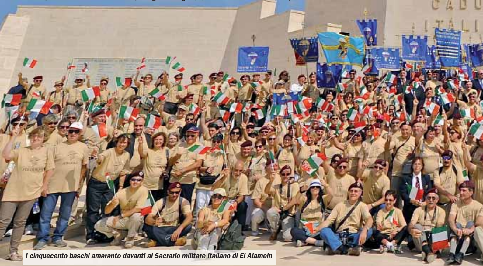
I cinquecento baschi amaranto davanti al Sacrario militare italiano di El Alamein

sti d'Italia hanno reso gli onori ai caduti italiani sepolti al Sacrario militare di El Alamein al cospetto: del Sig. Sottosegretario di Stato alla Difesa, Dott. Gianluigi Magri, accompagnato dal Console d'Italia, d'Alessandria d'Egitto, Mario Concetto Vinci, dal Generale di C. A. inc. paracadutista, Marco Bertolini, comandante del COI, il Gen. B. Massimo Panizzi, Capo Servizio Pubblica Informazione del Ministero della Difesa, e dall'addetto militare all'ambasciata del Cairo, Cap.