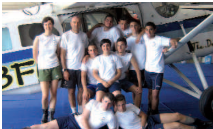
Allievi dell'8° corso con I.P. e alcuni momenti caratterizzanti le giornate addestrative