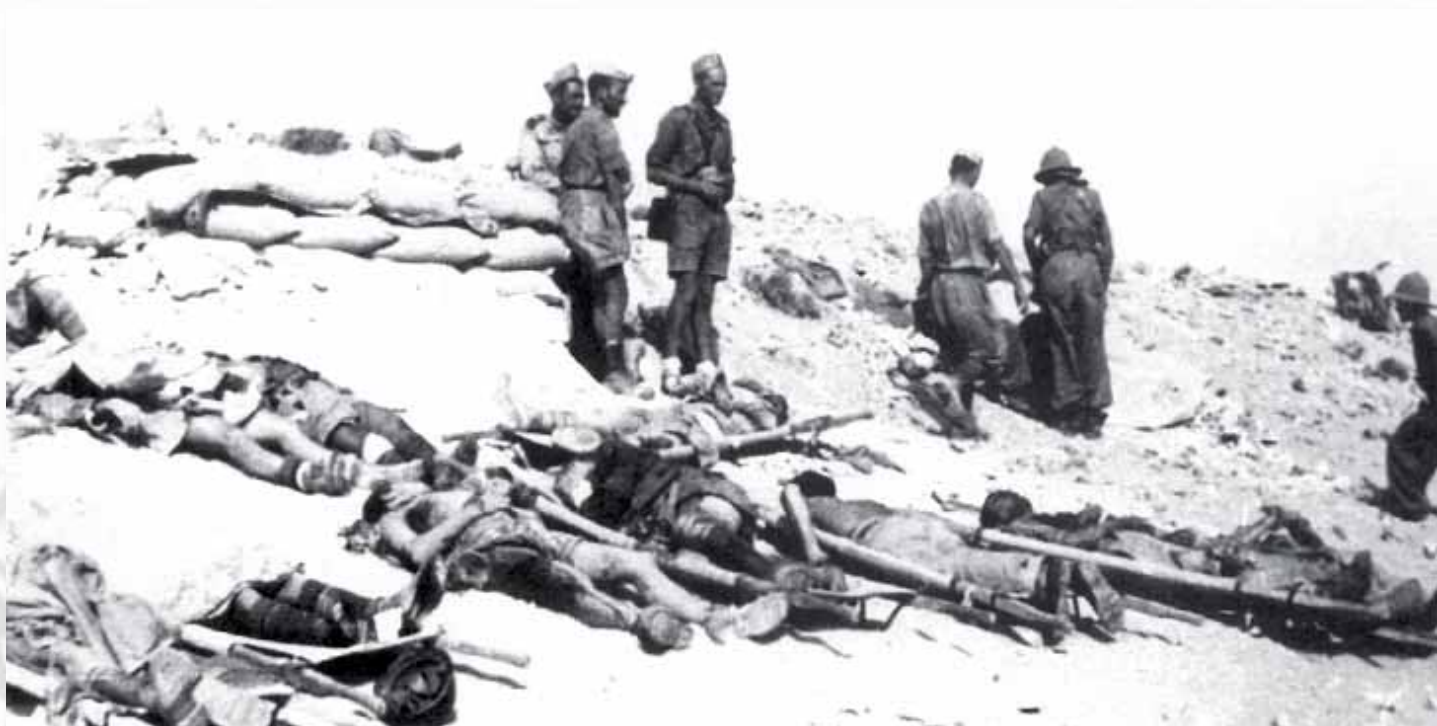
Postazioni della "Folgore" con i caduti recuperati dopo la grande battaglia

re un'azione dimostrativa. Un ordine che vorrei proprio vedere con questi occhi miei. Laggiù non c'era bisogno che Ella cercasse la sutura tra tedeschi e italiani, in modo di attaccare solo i secondi, cioè quelli che non avevano voglia di combattere. Pensi che fortuna, mio Lord: niente tedeschi, tutti italiani, proprio come voleva Lei. La Folgore, con altri reparti minori, tra cui il mio. Nel Suo volume Da Alamein al fiume Sangro, Ella ebbe la impudenza di affermare che Horrocks trovò un ostacolo impensato, i campi minati: e toglie implicitamente qualsiasi merito alla difesa fatta dall'uomo; vuol ignorare che quei campi erano stati creati anni prima dagli stessi inglesi, che vi esistevano strisce di sicurezza non minate e segrete, a noi ignote, che permisero ai Suoi carri di piombarci addosso in un baleno, accompagnati da fanterie poderose. Eppure l'enorme valanga,