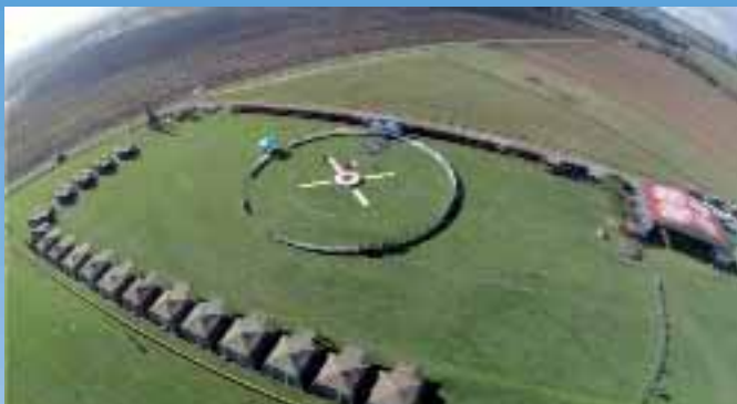
Spettacolare immagine ripresa da un paracadutista della zona di gara