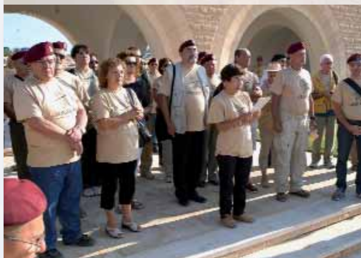
Si recita una prece al Sacrario britannico e francese