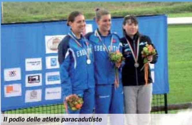
Il podio delle atlete paracadutiste