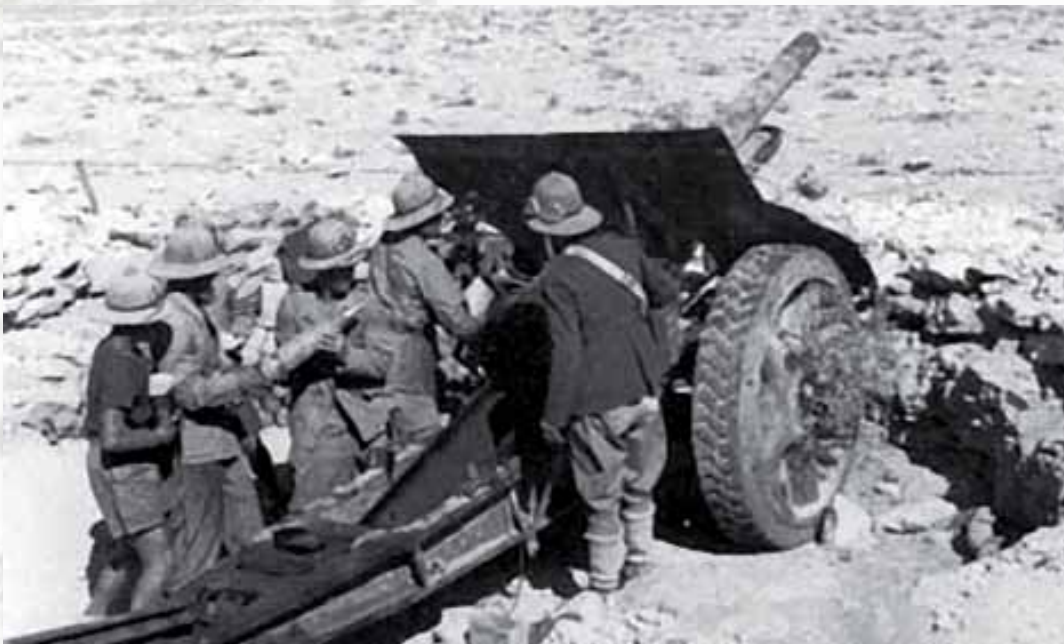
Pezzo di artiglieria da 100/17 mm. italiano mentre sta per essere caricato

Dopo quasi quattro giorni di intensi combattimenti, condotti da una divisione corazzata e due divisioni di fanteria britanniche insieme una brigata della «Francia Libera»; oltre a numerosi reparti di appoggio e centinaia di cannoni, contro solo 3.440 paracadutisti. Al prezzo di quasi due migliaia, tra caduti e feriti, più di un centinaio di carri armati distrutti, altre centinaia di cingolati e automezzi messi fuori uso, il nemico è fermo e at-