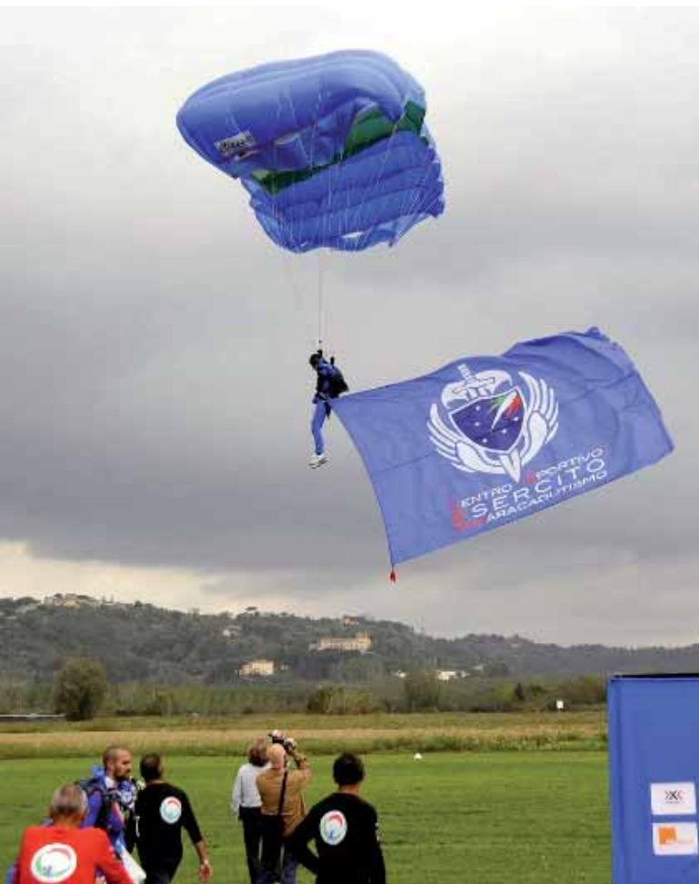
La bandiera del Centro Sportivo Esercito volteggiata sul campo di gara