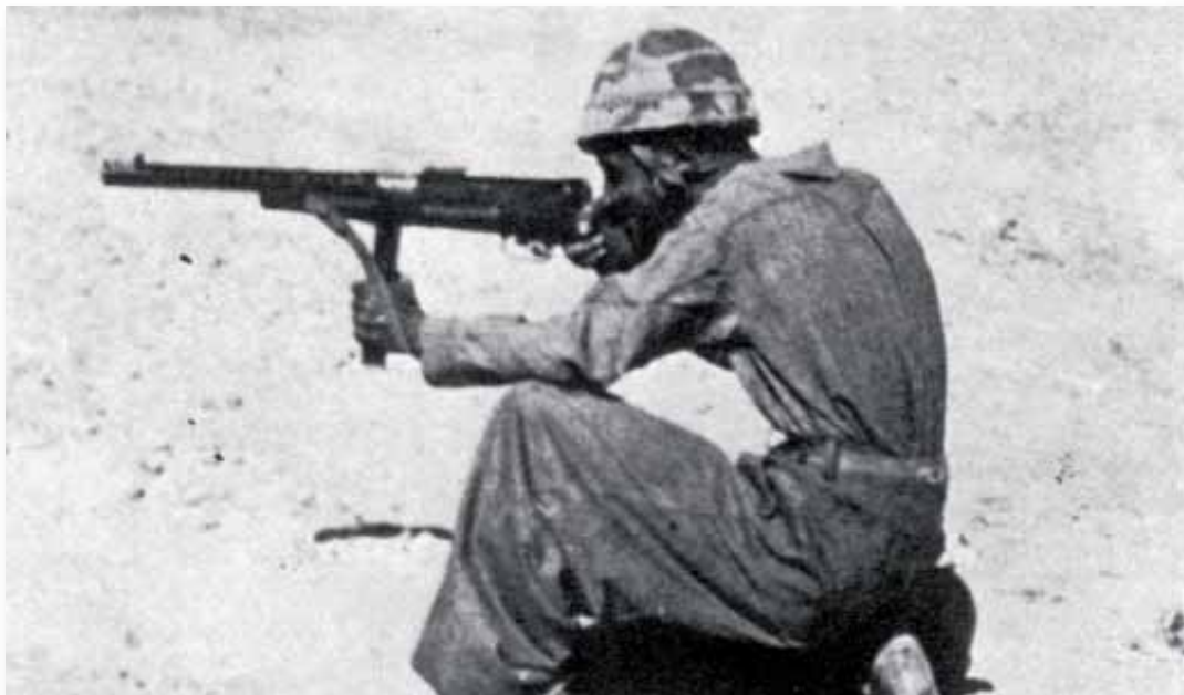
Paracadutista mentre apre il fuoco con il suo mitra "Beretta"

Verso le 16.00 di quel giorno, innanzi alle postazioni della «Folgore» si presentano, a gran velocità, circa 90 mezzi corazzati,