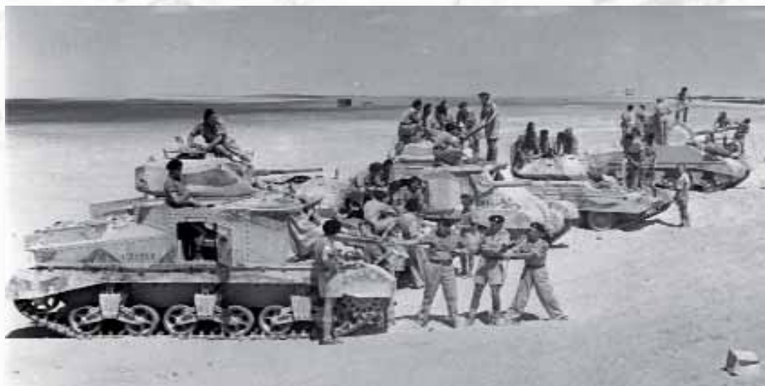
Carri armati «Grant», «Matilda» e «Sherman» utilizzati dagli anglosassoni per attaccare le postazioni della «Folgore»

A nord furono travolti, la notte stessa sul 24 ottobre 1942, due battaglioni tedeschi e tre italiani, ma una resistenza furiosa, a tergo, per otto giorni impedì a Lei di avanzare nonostante la documentata proporzione di uno a sei in Suo favore. Al centro, mio Lord, fu piccola giostra, ma quando quel settore ripiegò, la Bologna e l'Ariete Le dettero molto lavoro, come gliel'avevano dato, a nord, la Trento, la Trieste e la Littorio. A sud il Suo generale Horrocks, comandante il XIII corpo d'armata, avrebbe dunque avuto da Lei l'ordine di fa-