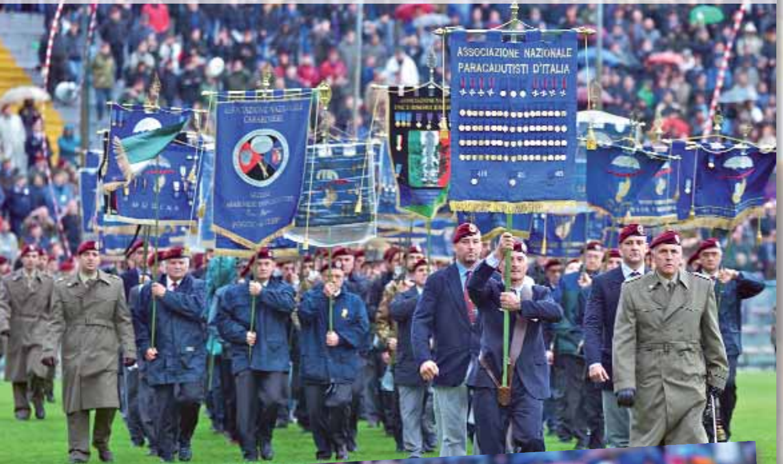
Il Medagliere Nazionale dei paracadutisti d'Italia seguito dai Labari delle Sezioni ANPd'I