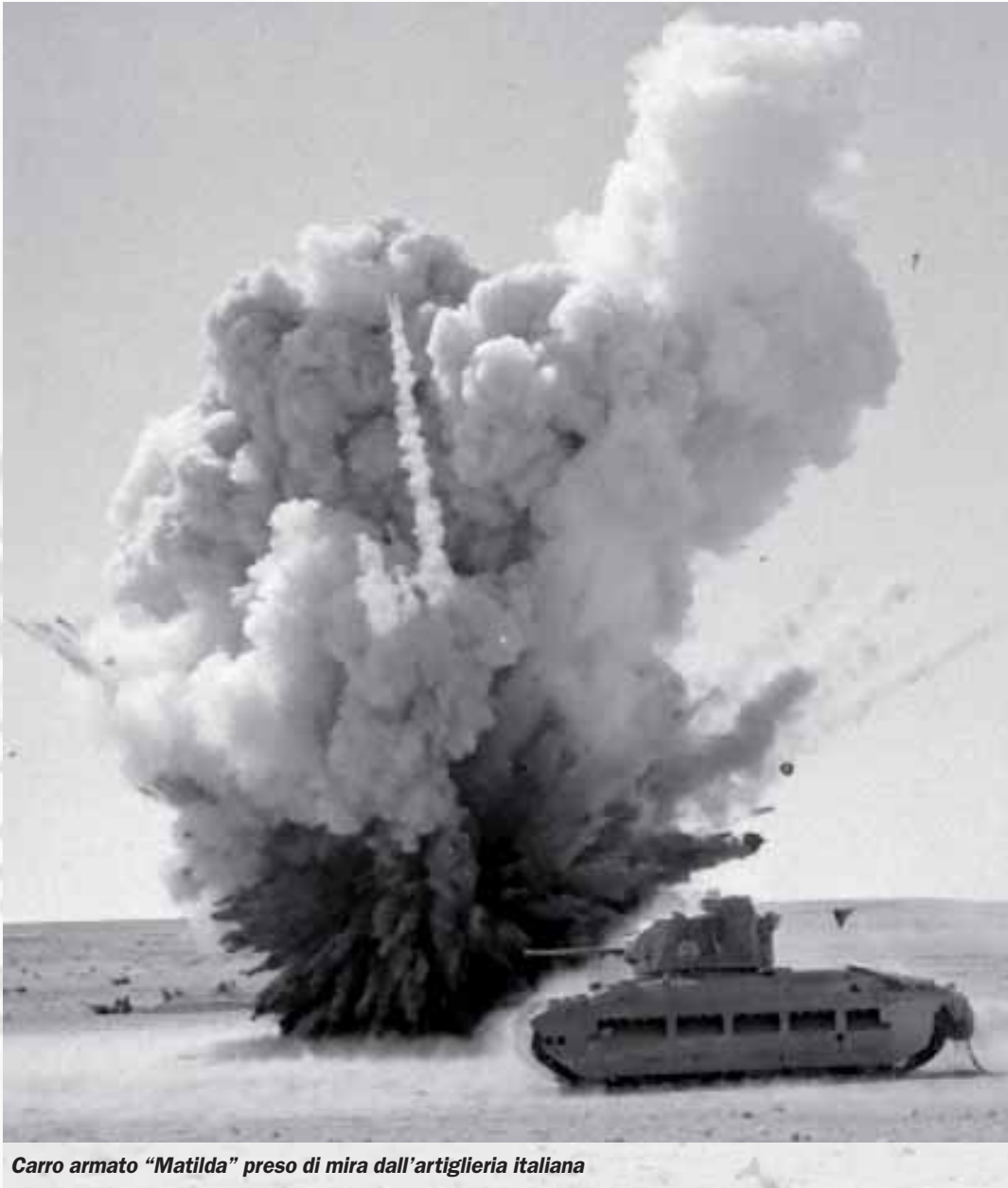
Carro armato "Matilda" preso di mira dall'artiglieria italiana

nea della 21ª Compagnia, in attesa del nemico.