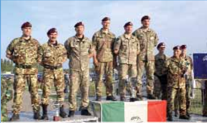
Le prime tre squadre classificate, da sinistra: Cremona, Brescia, Milano