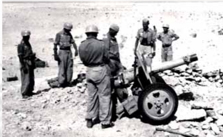
Paracadutisti tedeschi della brigata Ramke che a El Alamein confinavano con le postazioni della «Folgore»

I reparti dell'avversario che fronteggiavano la «Folgore», erano composti dal fior fiore delle truppe metropolitane britanniche, appartenenti al XIII Corpo d'Armata nell'ordine: la 7° Divisione corazzata (i noti "deserts rats"), le Divisioni di fanteria 44° e 50°, una brigata della «Francia Libera», il 44° Reggimento da ricognizione, diversi battaglioni autonomi: controcarro, genieri, mitraglieri; speciali formazioni d'assalto tratte dalla brigata sacra greca e da reparti neozelandesi e australiani. In sostanza almeno 21 battaglioni, a pieno organico, e 7 reggimenti corazzati composti da una cinquantina di carri armati ciascuno. Appoggiati da non meno di 350 cannoni di artiglieria campale. Per un numero complessivo di uomini vicino ai 50.000. Rapporti di forza, che pendevano numericamente a favore dell'avversario ancor più che negli altri settori dell'intera fronte. Qualitativamente, il confronto