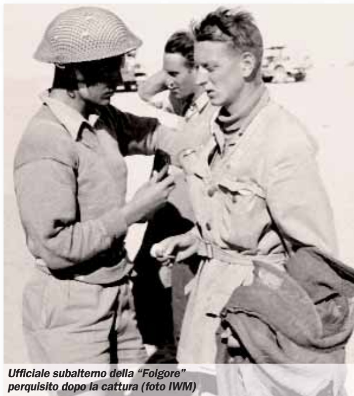
Ufficiale subalterno della "Folgore" perquisito dopo la cattura

Gli eventi incalzano e il ripiegamento si trasforma in rotta, i paracadutisti lasciati soli nel deserto senza viveri e acqua, marciano sostenendo diversi scontri con le avanguardie britanniche che ormai hanno ripreso il contatto balistico e li tallonano d'appresso. Verso il tramonto del giorno 4 dopo un violento fuoco di artiglieria da un altoparlante, in perfetto italiano, i britannici informano i paracadutisti della si-