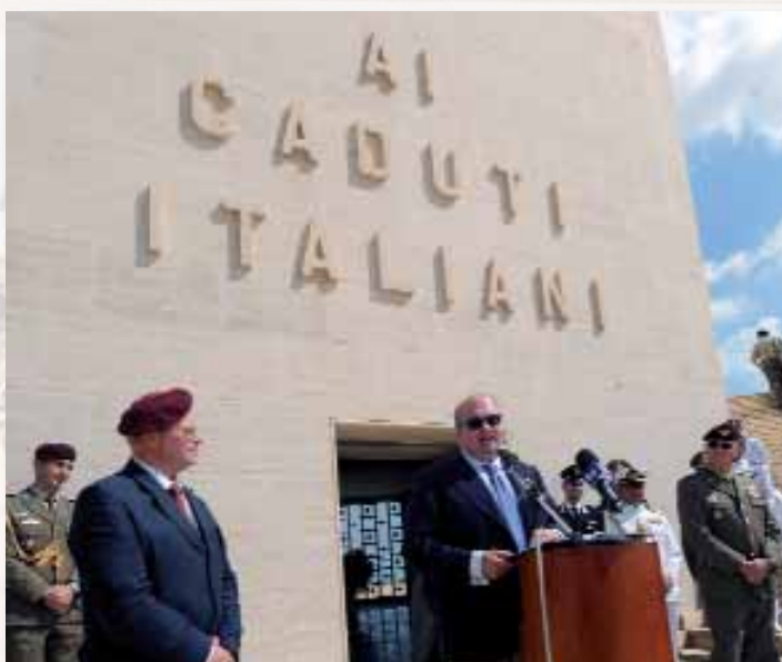
L'allocuzione del sottosegretario alla Difesa

volto alla mappatura e il ripristino dei siti della battaglia dell'Università di Padova, che vede insieme all'ANPd'I, il SIGGMI (Società Italiana di Geologia e Geografia Militare), e la testata telematica «congedati Folgore».