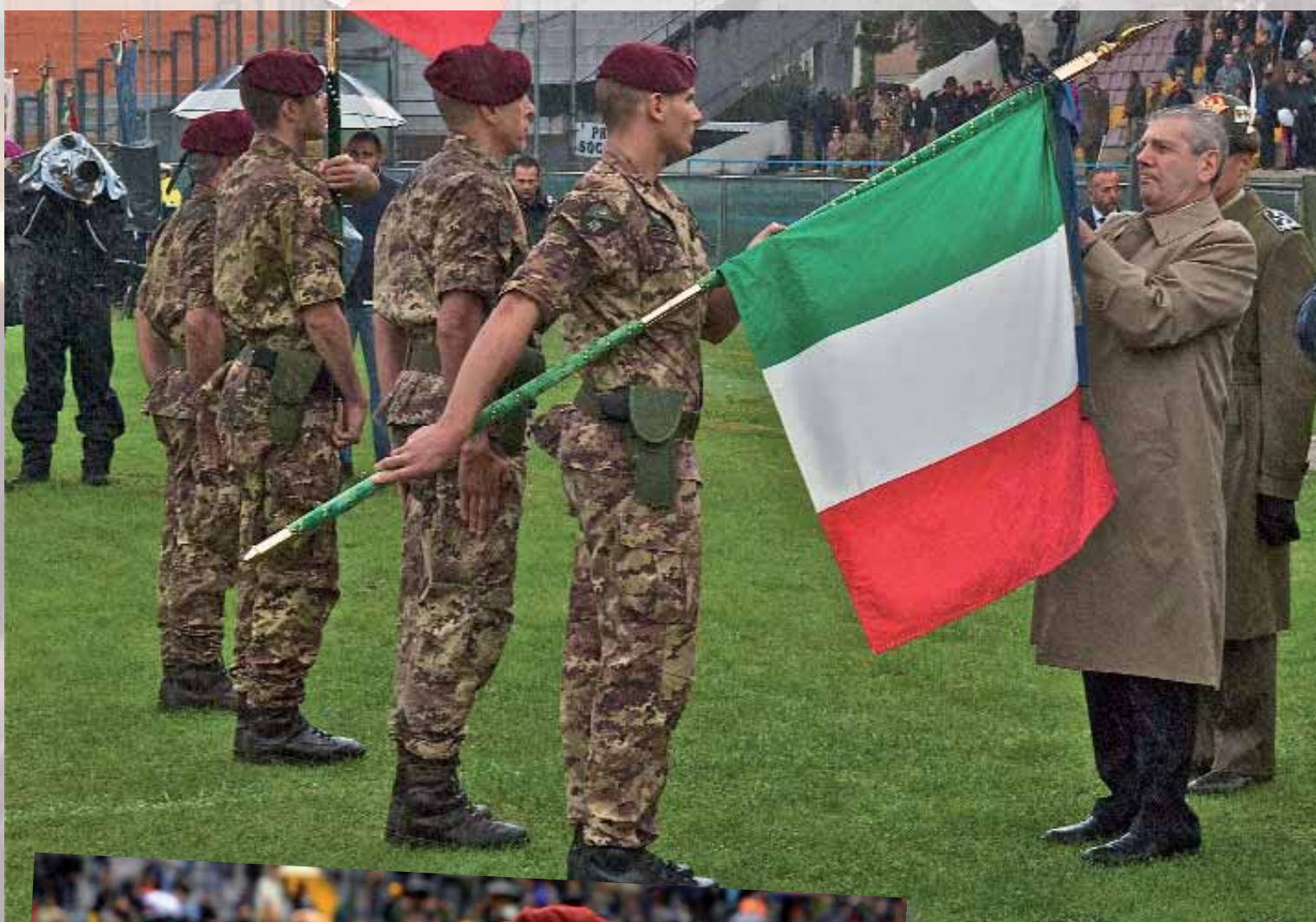
Il Ministro Di Paolo decora le Bandiere di Guerra