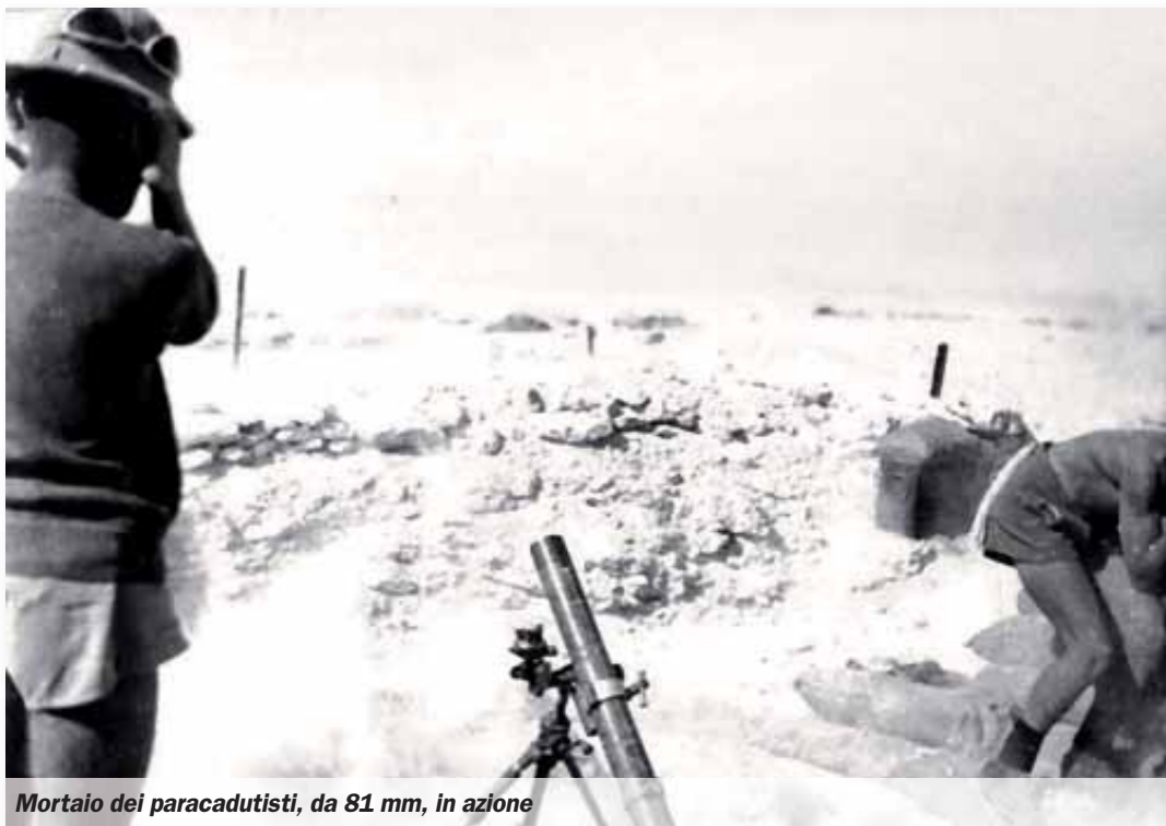
Mortaio dei paracadutisti, da 81 mm, in azione

tonito. È riuscito solo a conquistare alcune posizioni della linea di sicurezza senza minimamente intaccare quella di resistenza. Altri violenti scontri si consumano nella notte dal 28 al 29 e il 31 ottobre, sempre contro le postazioni della 10 e della 25 compagnia a Deir el Munassib. I fucilieri di marina, "degolli-sti" di un reparto denominato la «Tortue», vengono ricacciati nelle loro postazioni di partenza e perdono in combattimento anche il loro gagliardetto.