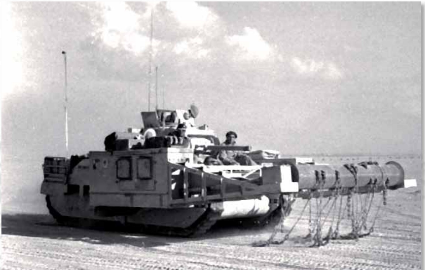
Uno dei carri sminatori «Matilda Scorpion» impiegato sul fronte della Div. «Folgore»

posizione dei britannici, che indirizzando il loro tiro sui campi minati posti davanti alle linee italo-tedesche, e progressivamente lo allungarono sino a inquadrare e sconvolgere le postazioni difensive delle forze dell'Asse.