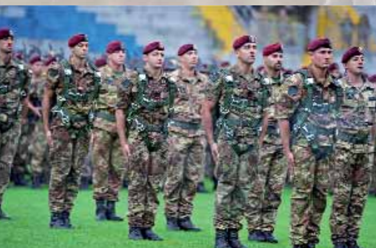
Il cambio paracadute

con apertura comandata dei campioni mondiali di paracadutismo della Brigata paracadutisti «Folgore», per la pioggia