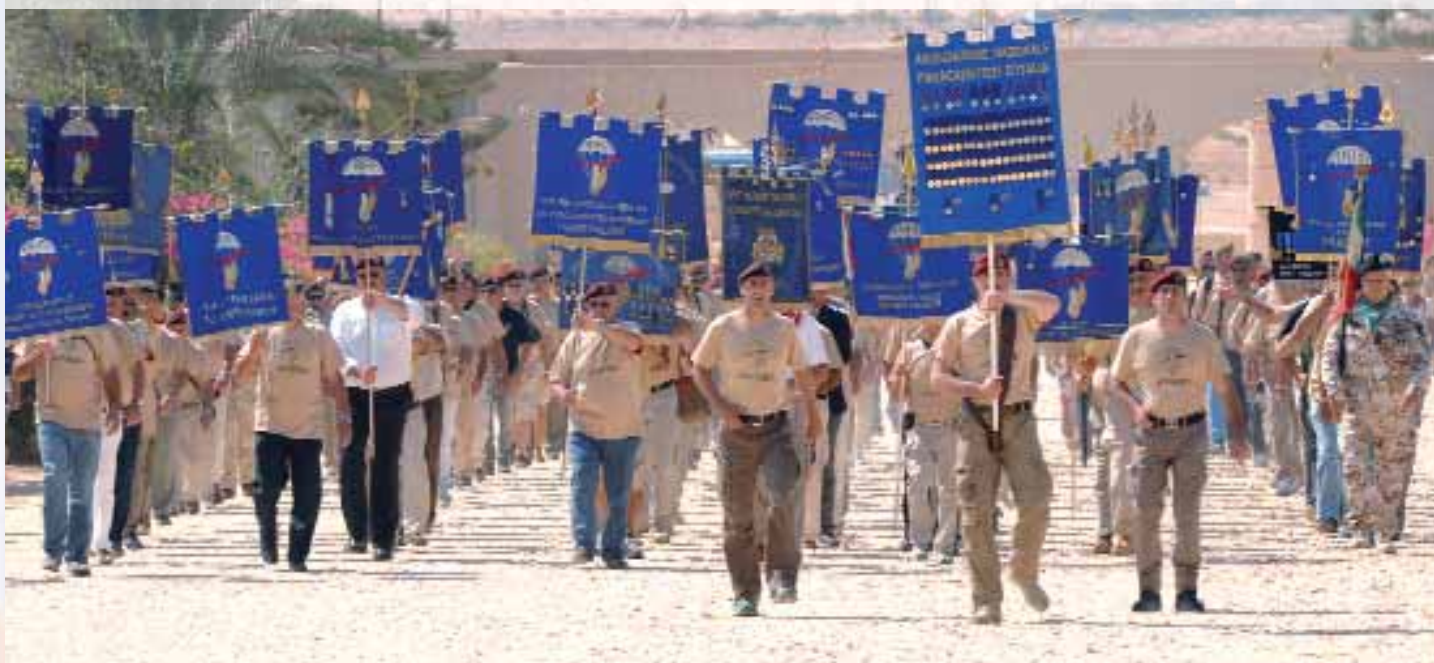
Arrivederci El Alamein

“Ultimo giorno di permanenza a El Alamein i paracadutisti d'Italia porgono un corale saluto al Sacrario militare italiano”