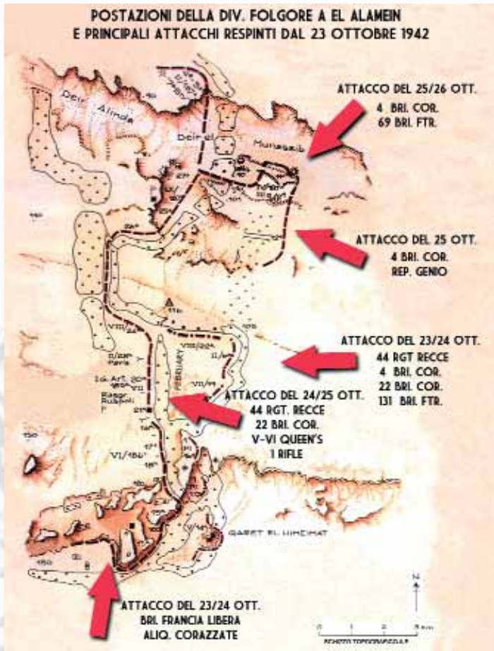
Schizzo topografico della disposizione della Div. "Folgore" a El Alamein e i principali combattimenti sostenuti

loro. Scopo di questo tipo di disposizione delle truppe sul terreno, era far sì che il miglior armamento tedesco compensasse la scarsa potenza di fuoco dei reparti italiani. All'atto pratico questo tipo di accorgimento procurò più danni che benefici, al punto che, durante lo svolgimento della battaglia, i reparti tornarono alle dipendenze delle loro unità di provenienza; sottoposti così al vincolo di un'unica catena di comando, principale motivo del mancato funzionamento dei «raum» stessi. I battaglioni paracadutisti d'arma base, con l'accorpamento del IX e X resosi necessario dopo le perdite nei combattimenti di Deir Alinda, ammontavano a