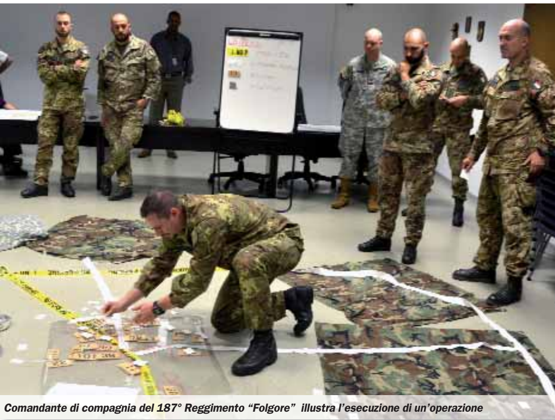
Comandante di compagnia del 187° Reggimento «Folgore» illustra l'esecuzione di un'operazione

(Testo e immagini cortesia PIO Bri.Par. «Folgore»)