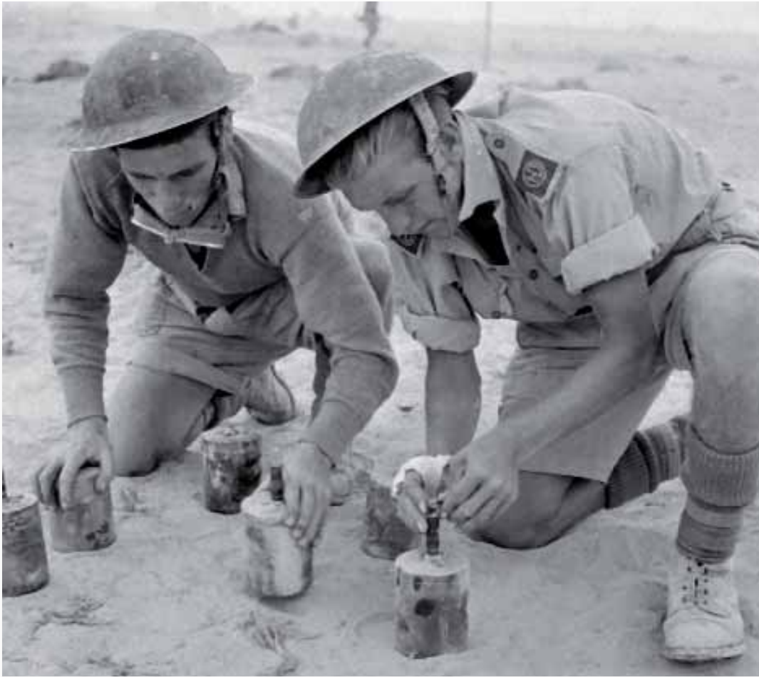
Genieri britannici mentre disinnescano mine antiuomo nei "giardini del diavolo"