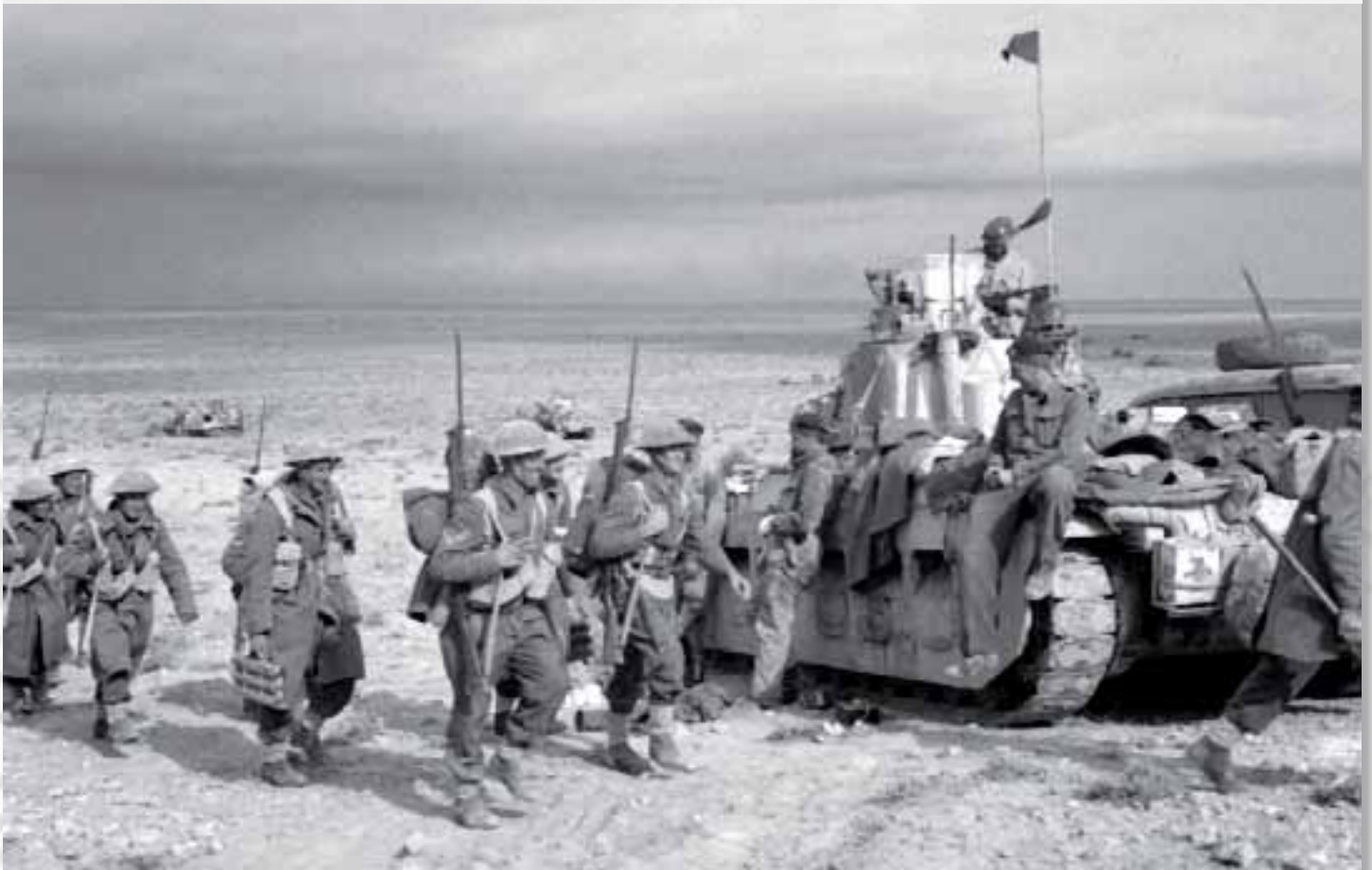
Truppe neozelandesi mentre marciano sulla linea del fronte di El Alamein