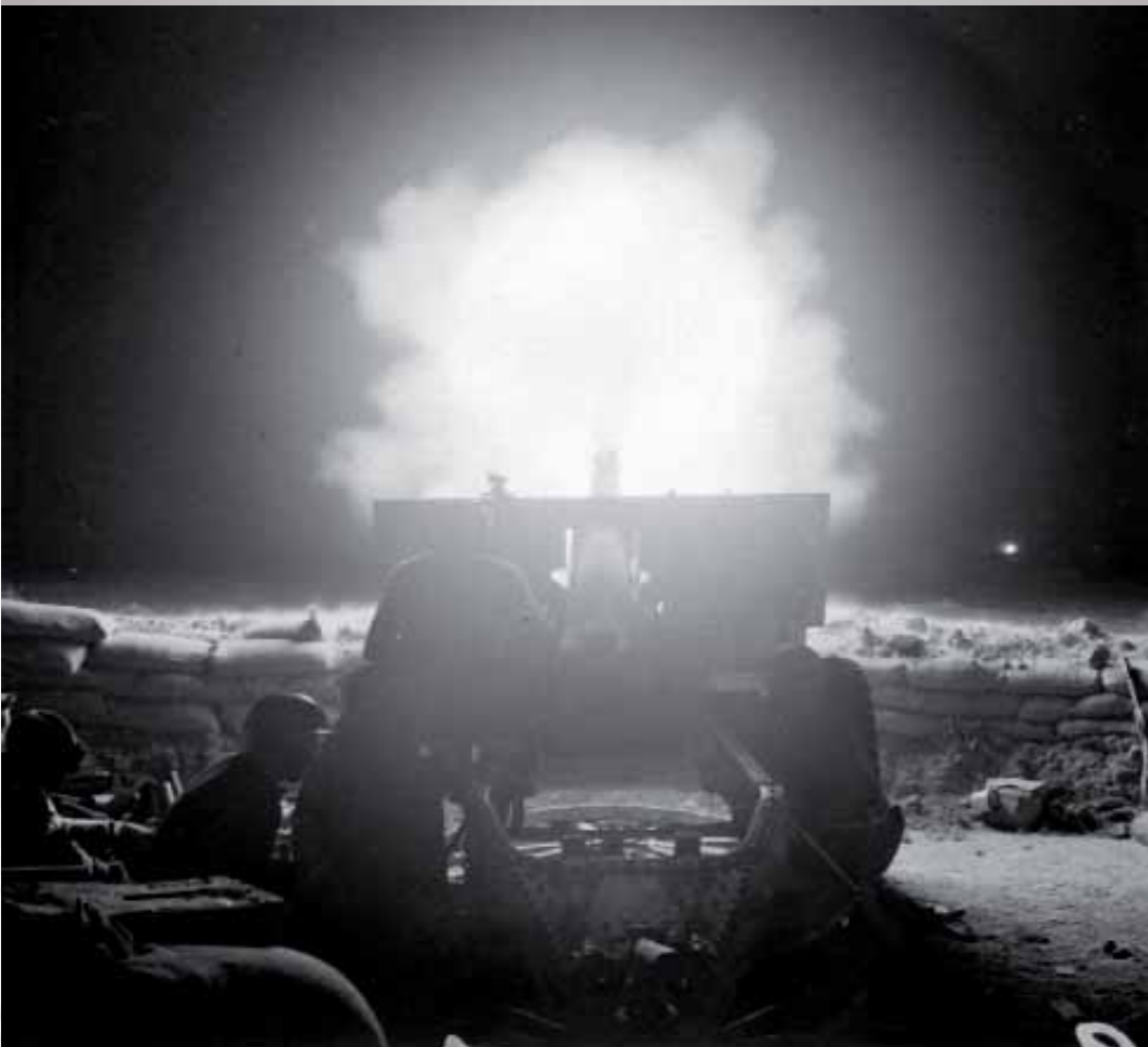
Cannone britannico da 88 mm mentre apre il fuoco sulla linea di El Alamein la notte del 23 ottobre 1942

Alle 20.45 del 23 ottobre 1942, come previsto, ebbe inizio un eccezionale fuoco di preparazione lungo tutta la linea della fronte di El Alamein, da parte di tutte le batterie d'artiglieria a dis-