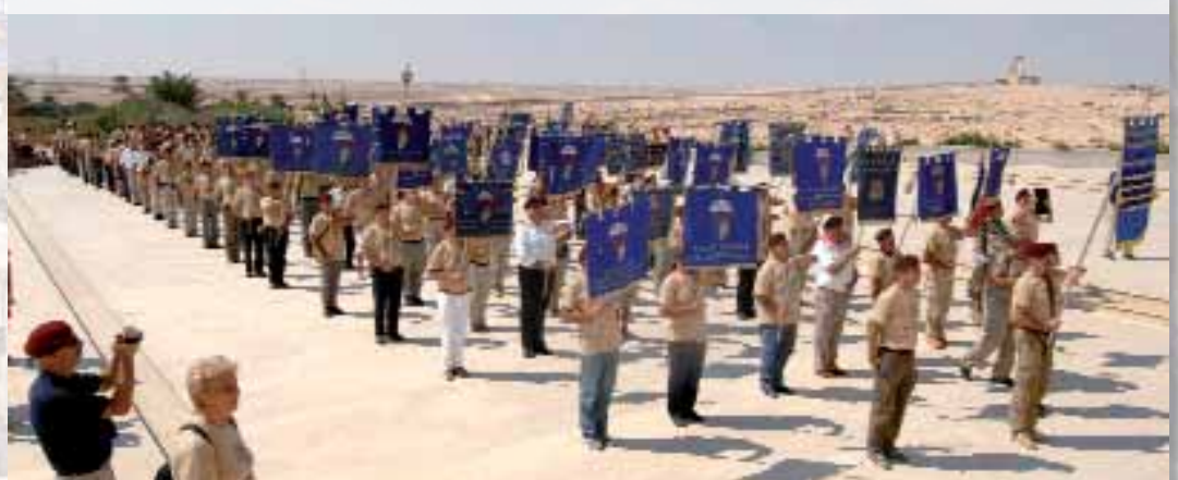
“Viandante arrestati e riverisci!”

Durante quella sera l'organizzatore ANPd'I, ha dichiarato concluso il pellegrinaggio, così dopo una