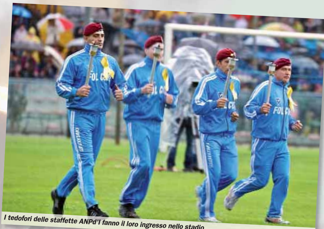
I tedofori delle staffette ANPd'I fanno il loro ingresso nello stadio