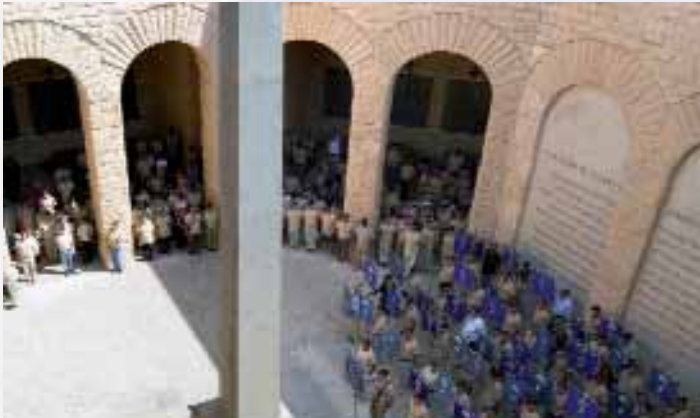
L'omaggio dei paracadutisti ai commilitoni germanici, presso il loro sacrario

paracadutisti e dalle sezioni dell'ANPd'I, rappresenta il primo esperimento di fruizione di un parco storico itinerante. Attraverso le soste sulle postazioni e le precise spiegazioni geografiche/storiche dei due professori, i partecipanti hanno provato, fisicamente ed emotivamente, un coinvolgimento senza pari. Tale è stato il commento unanime degli escursionisti.