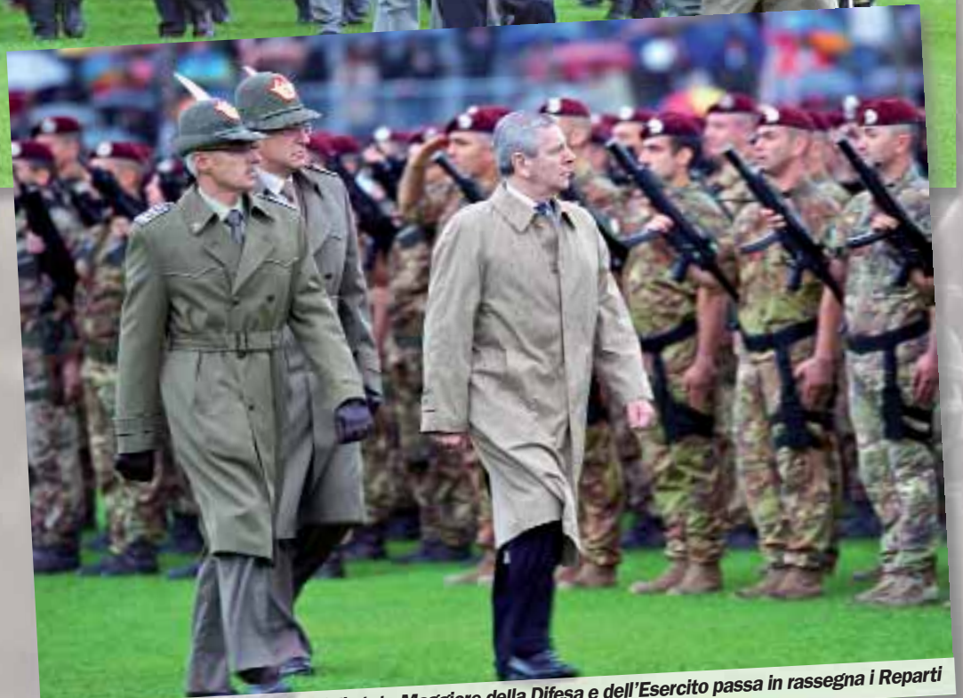
Il Ministro della Difesa con i capi di stato Maggiore della Difesa e dell'Esercito passa in rassegna i Reparti

con lo stesso coraggio, per la nostra sicurezza, come stanno facendo i due marò tratti in India.