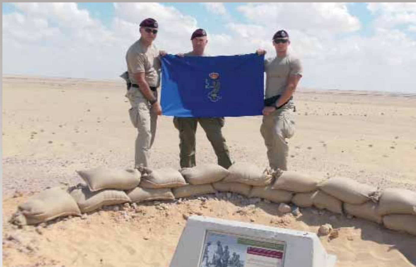
La Bandiera del 187° Rgt. dopo 70 anni torna a garrire sulle postazioni della 6ª Compagnia, tenuta dai paracadutisti in servizio del reggimento stesso

F inalmente si parte, il tempo è cupo e piove, anzi per strada un vero diluvio, ma noi siamo conten-