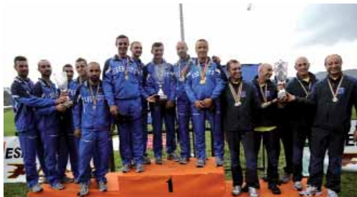
Le prime tre squadre classificate sul podio

dal 50% dei migliori atleti in classifica individuale maschile e femminile.