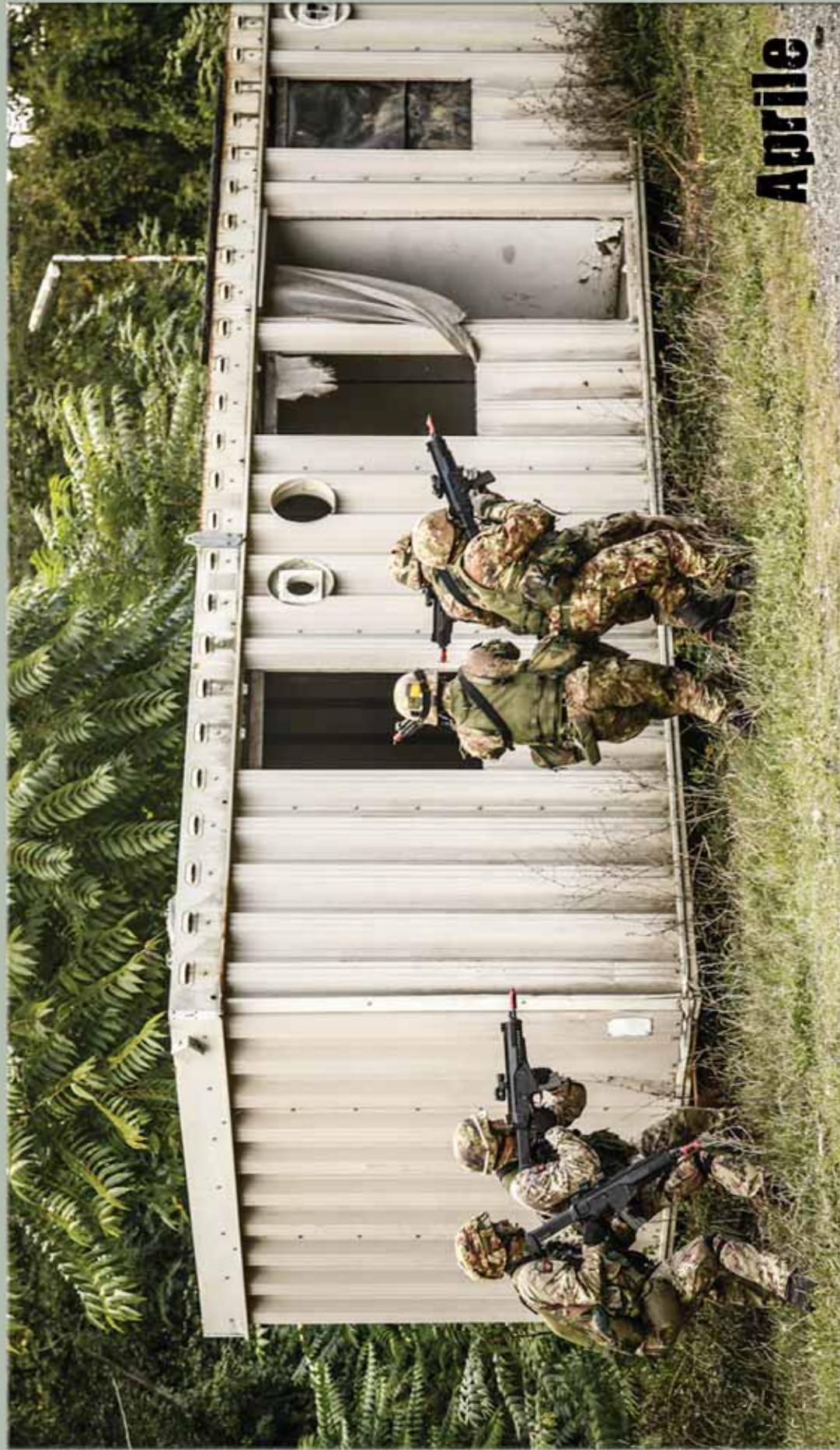
"Di fulgida gloria vigile scolta" 187° Reggimento Paracadutisti "Folgore" BRIGATA PARACADUTISTI FOLGORE