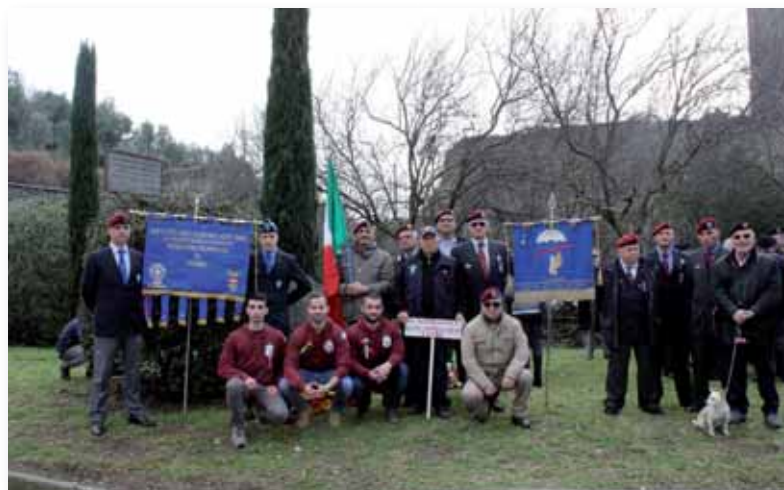
Celebrazione della Giornata del Ricordo