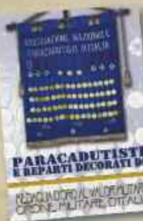
PARACADUTISTI E REPARTI DECORATI DI MEDAGLIA D'ORO AL VALOR MILITARE ORDINE MILITARE D'ITALIA