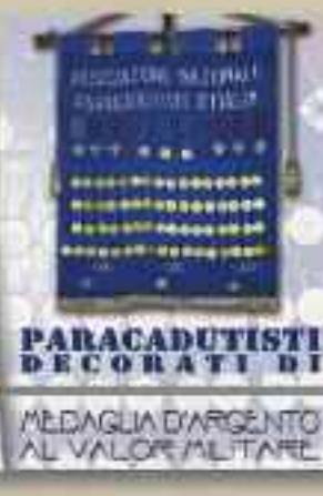
PARACADUTISTI DECORATI DI MEDAGLIA D'ARGENTO AL VALOR MILITARE