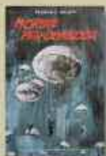
MORIRE PER QUALCOSA di B. NALDINI