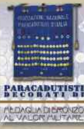
PARACADUTISTI DECORATI DI MEDAGLIA DI BRONZO AL VALOR MILITARE