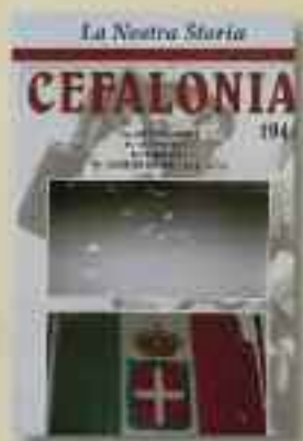
CEFALONIA a cura di G. Giostra, A. Milani e D. Orro