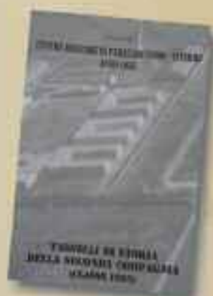
TASSELLI DI STORIA DELLA SECONDA COMPAGNIA di G. Perissin