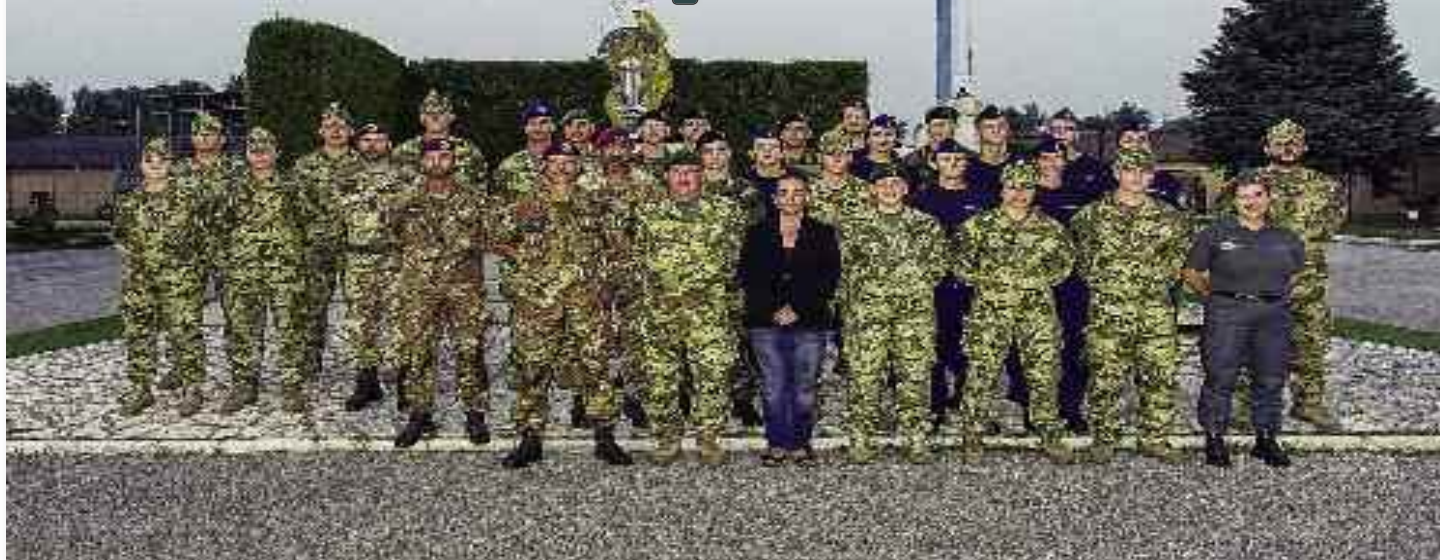
(Testo e immagini cortesia Magg. Giuseppe LA IANCA 8° Rgt. Genio Guastatori Par. "Folgore" Uff. P.I.O.)