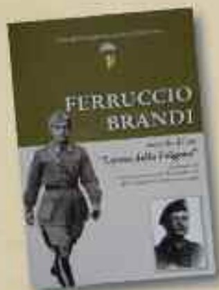
FERRUCCIO BRANDI a cura di G. Giostra, A. Milani e D. Orro