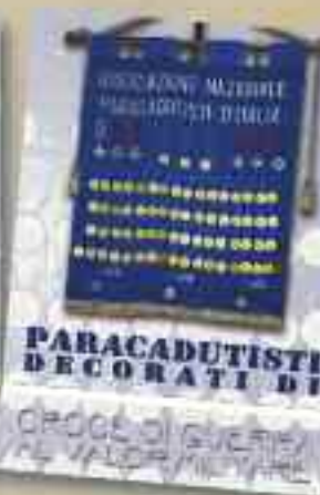
PARACADUTISTI DECORATI DI CROCE DI GUERRA AL VALOR MILITARE

COFANETTO "PARACADUTISTI E REPARTI DECORATI" N. 4 VOLUMI: MEDAGLIA D'ORO AL VALOR MILITARE E ORDINE MILITARE D'ITALIA, MEDAGLIA D'ARGENTO AL VALOR MILITARE, MEDAGLIA DI BRONZO AL VALOR MILITARE - CROCE DI GUERRA AL VALOR MILITARE