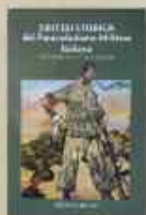
SINTESI STORICA DEL PARACADUTISMO MILITARE a cura di G. Giostra, A. Milani e D. Orro